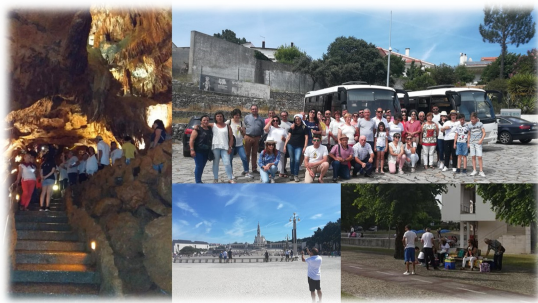
FIGURA 5: PASSEIO A FÁTIMA