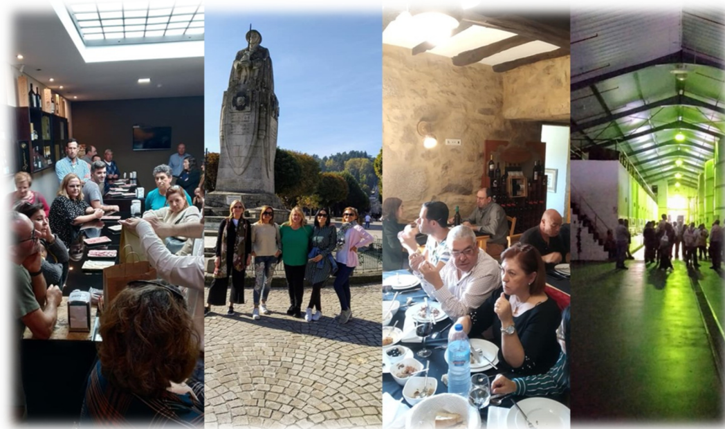
FIGURA 7: PASSEIO A LAMEGO

Foi um dia agradável em que se promoveu o convívio e a amizade entre os colaboradores do município, participaram neste passeio 33 associados.