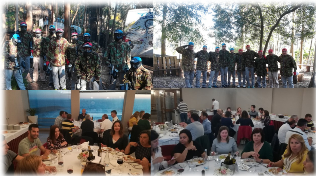
FIGURA 3: DIA DO ASSOCIADO