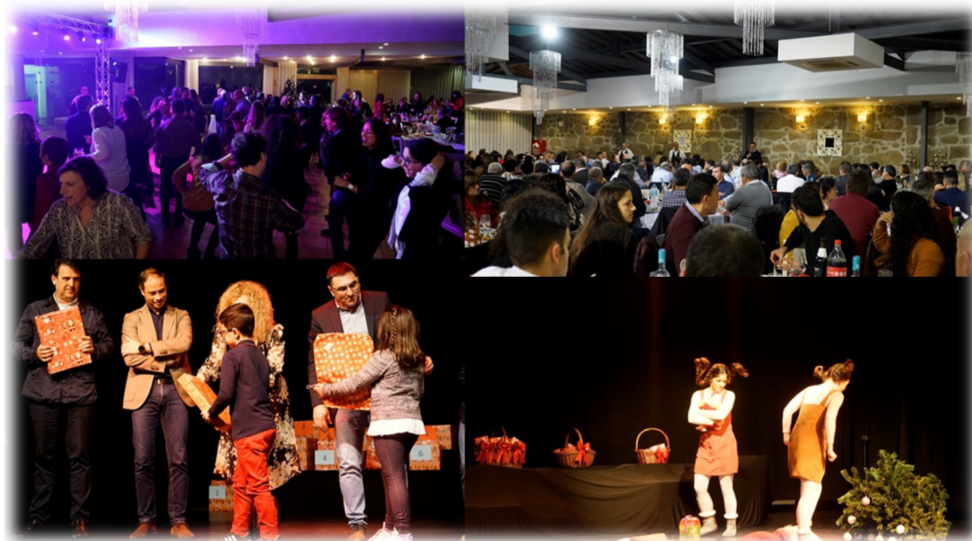
FIGURA 10: FESTA DE NATAL MUNICÍPIO DE ESPOSENDE