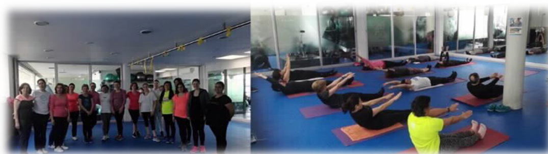
FIGURA 9: AULAS DE GINASTICA E PILATES

Infelizmente em 2020 não foi possível continuar com as aulas, a associação já tinha garantido os professores e também uma nova forma de gestão das aulas.