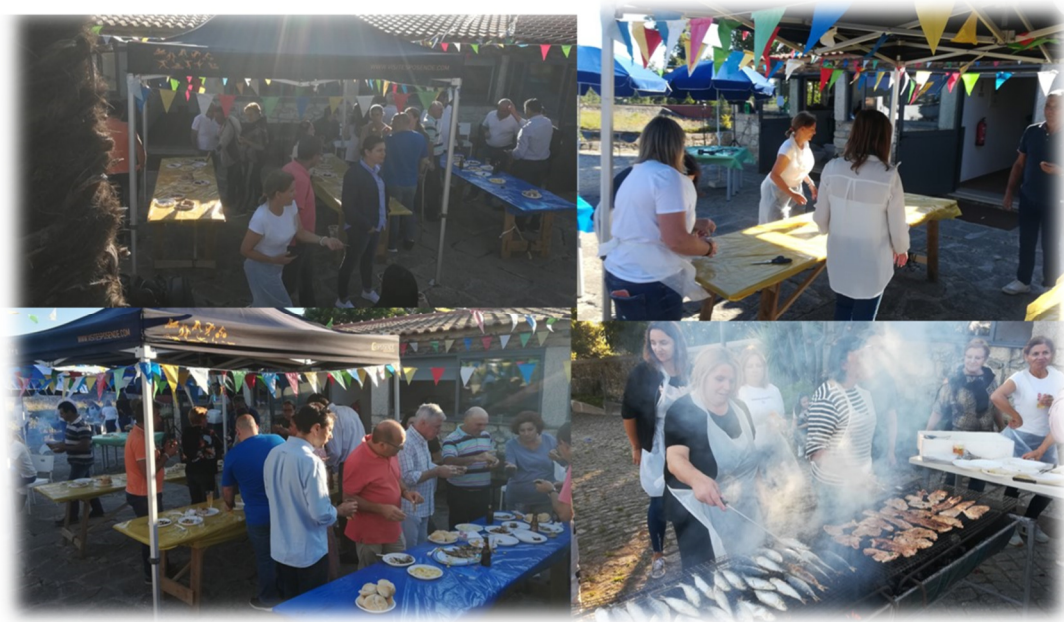
FIGURA 8: SANTOS POPULARES