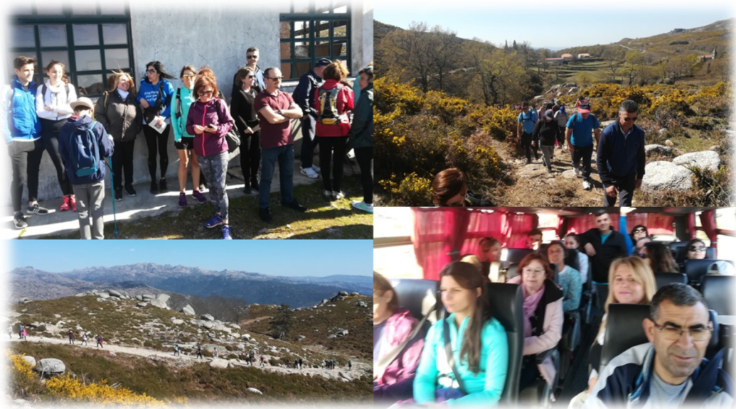
FIGURA 6: FESTIVAL DE CAMINHADAS NO GERÊS