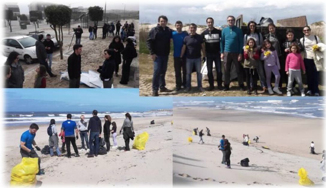
FIGURA 4:AÇÃO DE LIMPEZA