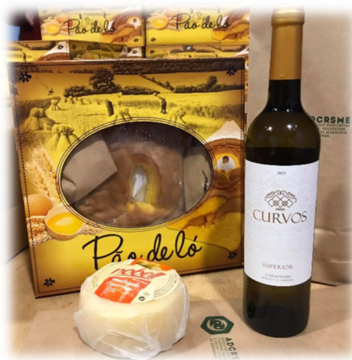
FIGURA 2: ENTREGA FOLAR DA PÁSCOA

358 folares, que representa um aumento de 8 % face ao ano anterior, o crescimento reflete como é evidente, o aumento do número de associados inscritos.